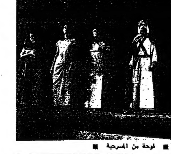
لوحة من المسرحية